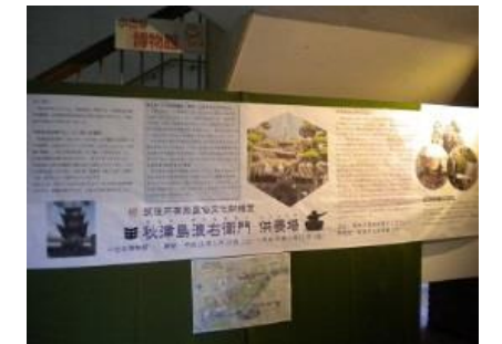
ミニ展示のようす

その供養塔がこの度、筑後市有形民俗文化財に指定され、4月19日に文化財指定書交付式が執り行われました。それを受けてサンコア1階ロビーにて、ミニ展示が行われました。